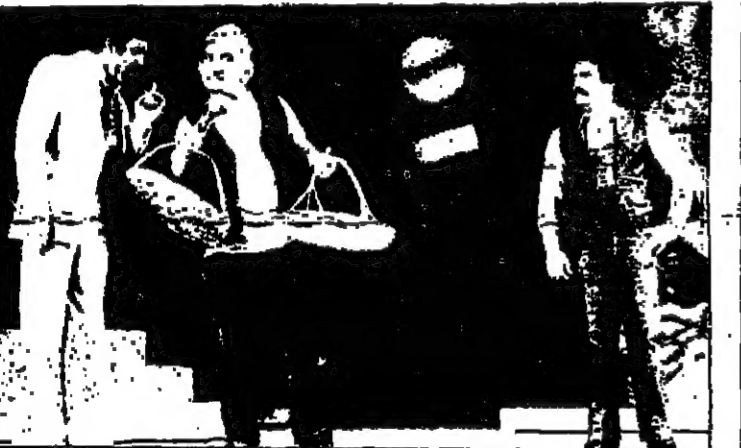
«المؤامرة مستمرة» لعبة السياسة على المسرح !

والشهر الثالث بالوالي الرحمانية نظيم (المؤامرة مستمرة) برم كل الذي يقوله القاد عنها في مسرح يستوعب اكثر من 7٠٠ مشاهد ، كذلك حال «بربر اغا» فهي تقدم في صالة تستوعب اكثر من المئتين وخمسين الفا .